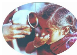
一滴の水から始まる自立への支援

★参加費は、ミャンマー・カチン州の難民の子どもたちを支援する「子ども村」建設に役立てさせていただきます。 (場所)：ミャンマー・カチン州バモ郡ドウ・ファン・ヤン地区ライザ(内容)： ① 内戦で傷ついた子どもたちの自立を支援する施設の建設 ② ①の後、食料・衣服の供給、教育支援、ヘルスケア、職業訓練等の実施